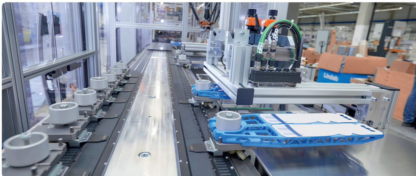
In der Zahnbürsten-Verpackungsanlage von Koch Pac-Systeme ersetzt XTS aufwendige Mechanik durch Software-Funktionalität und sorgt so für eine kompakte Bauform, hohe Flexibilität und extrem kurze Produktwechselzeiten.

nen zum Beispiel durch bessere Druckverfahren, Sichtfenster oder ergonomisches Verpackungsdesign berücksichtigt werden. Ein Beispiel sind einfachere Verschlussysteme, um die im Alter geringere Kraft und Beweglichkeit der Finger auszugleichen.