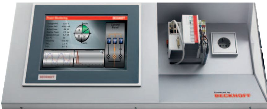
Ausgestattet mit einer Energiemessklemme aus der Baureihe EL34x3 werden die Messwerte präzise erfasst und in die Microsoft-Cloud übertragen.

sumer-Markt und auch nur noch einmal im Quartal.