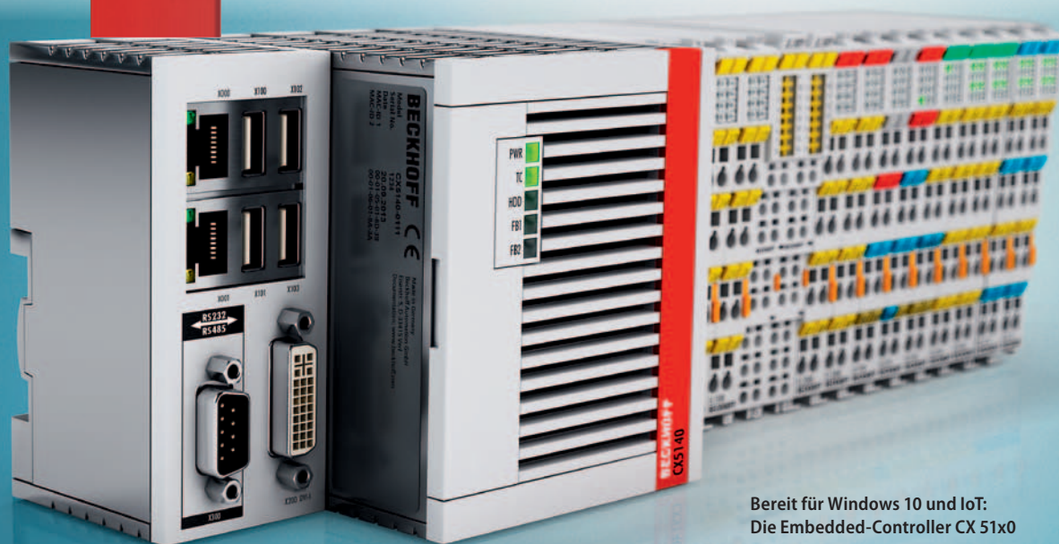
Bereit für Windows 10 und IoT: Die Embedded-Controller CX 51x0