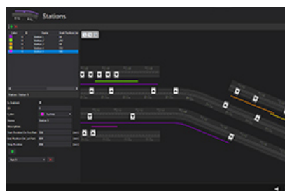
XTS Simulation Builder - Stations