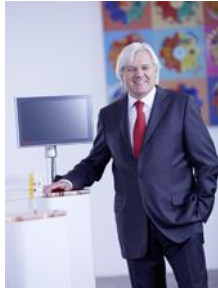
Imagen de prensa: