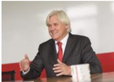
Imagen de prensa: