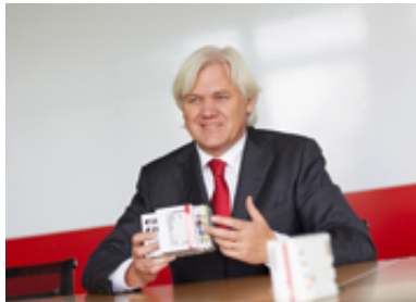
Imagen de prensa: