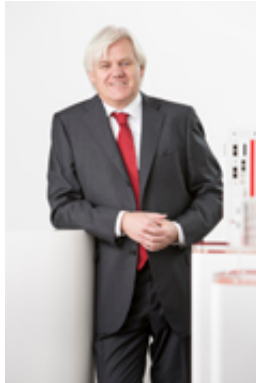
Imagen de prensa: