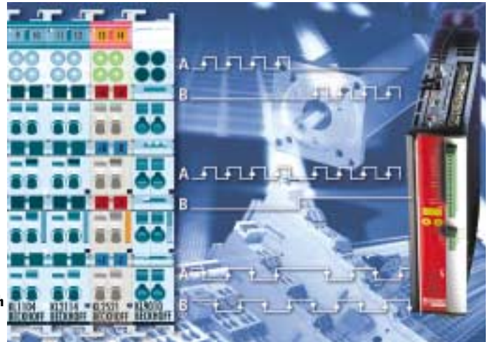
2: Servoverstärker oder Frequenzumrichter lassen sich einfach an die Busklemme anschließen